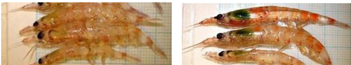
Figure 3 : Couleur du krill (alimentation). Image de gauche = 0 (transparent). Image de droite = 1 (coloration vert-brun).

Coloration du krill : La présence ou l'absence de coloration vert-brun (voir figure 3) des intestins ou du foie (preuve de l'alimentation) doit être notée pour tous les individus de krill mesurés.